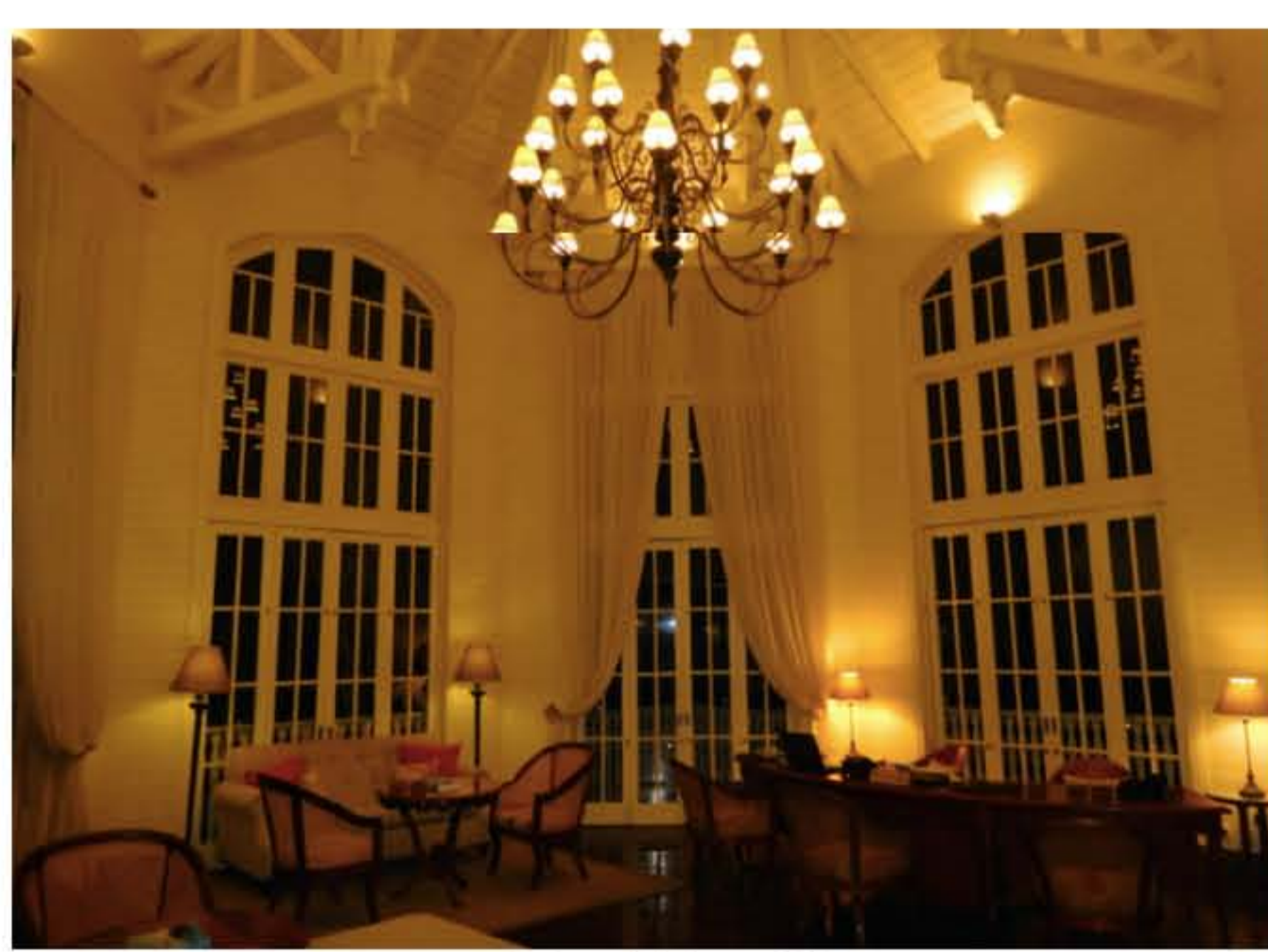
Le charme de la demeure Telfair