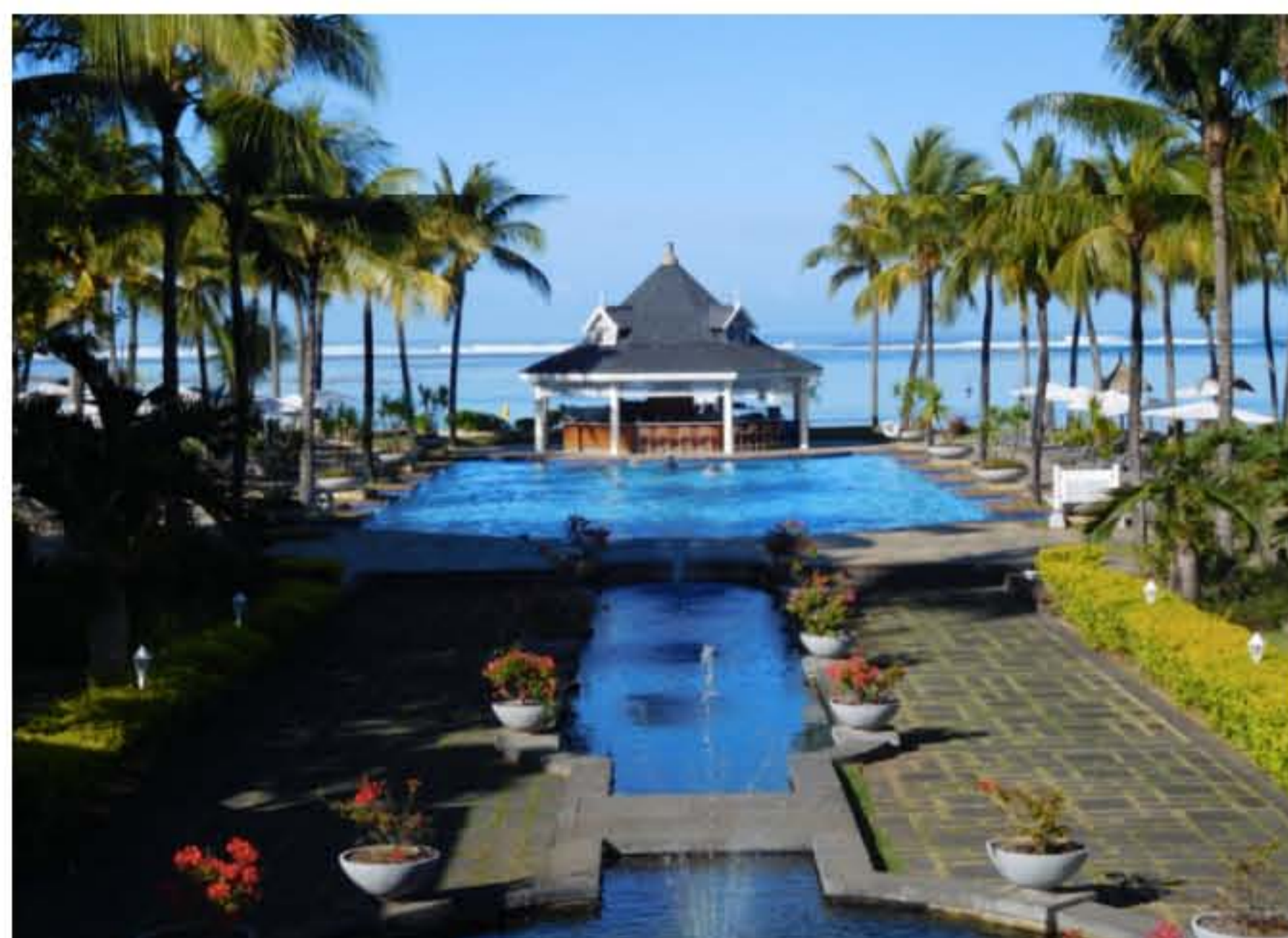
Le lagon toujours en perspective

Reconnaisable à ses toits gris bleutés, niché à Bel Ombre, le Telfair est un modèle d'architecture. Des varangues à colonnades, des lambrequins, des faïences et hauteurs de plafond, le chic de son mobilier Compagnie des Indes: aucune ostentation dans ce 5 étoiles, une qualité de service rare: à expérimenter d'urgence!