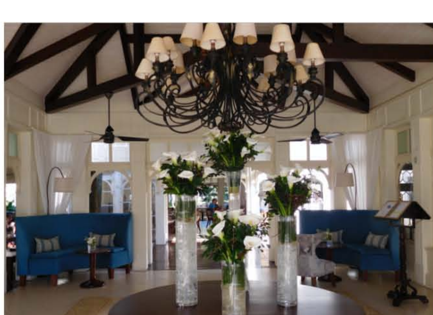
Le raffinement est partout...