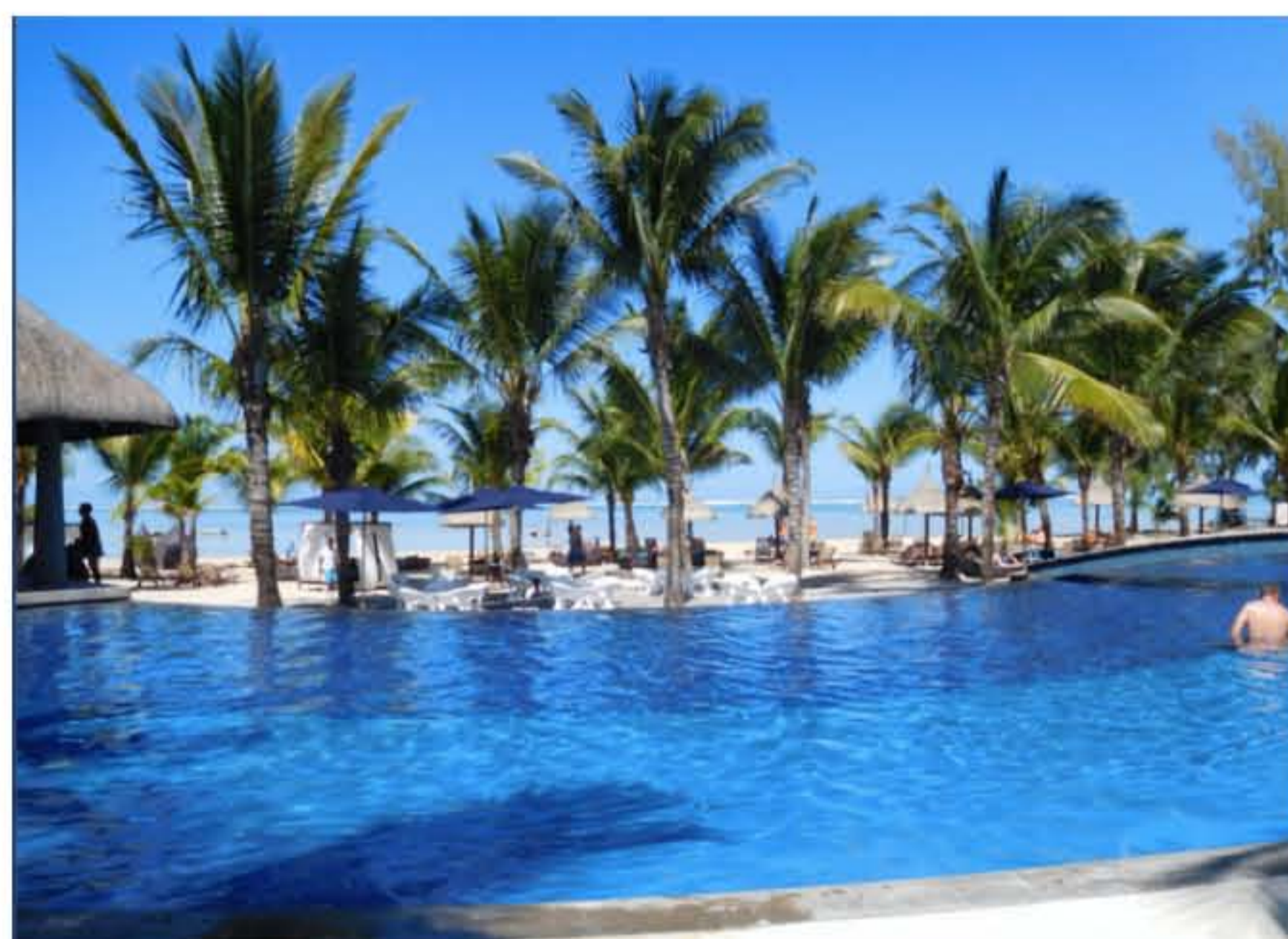
Le C Beach Club où il fait bon se prélasser après le golf!