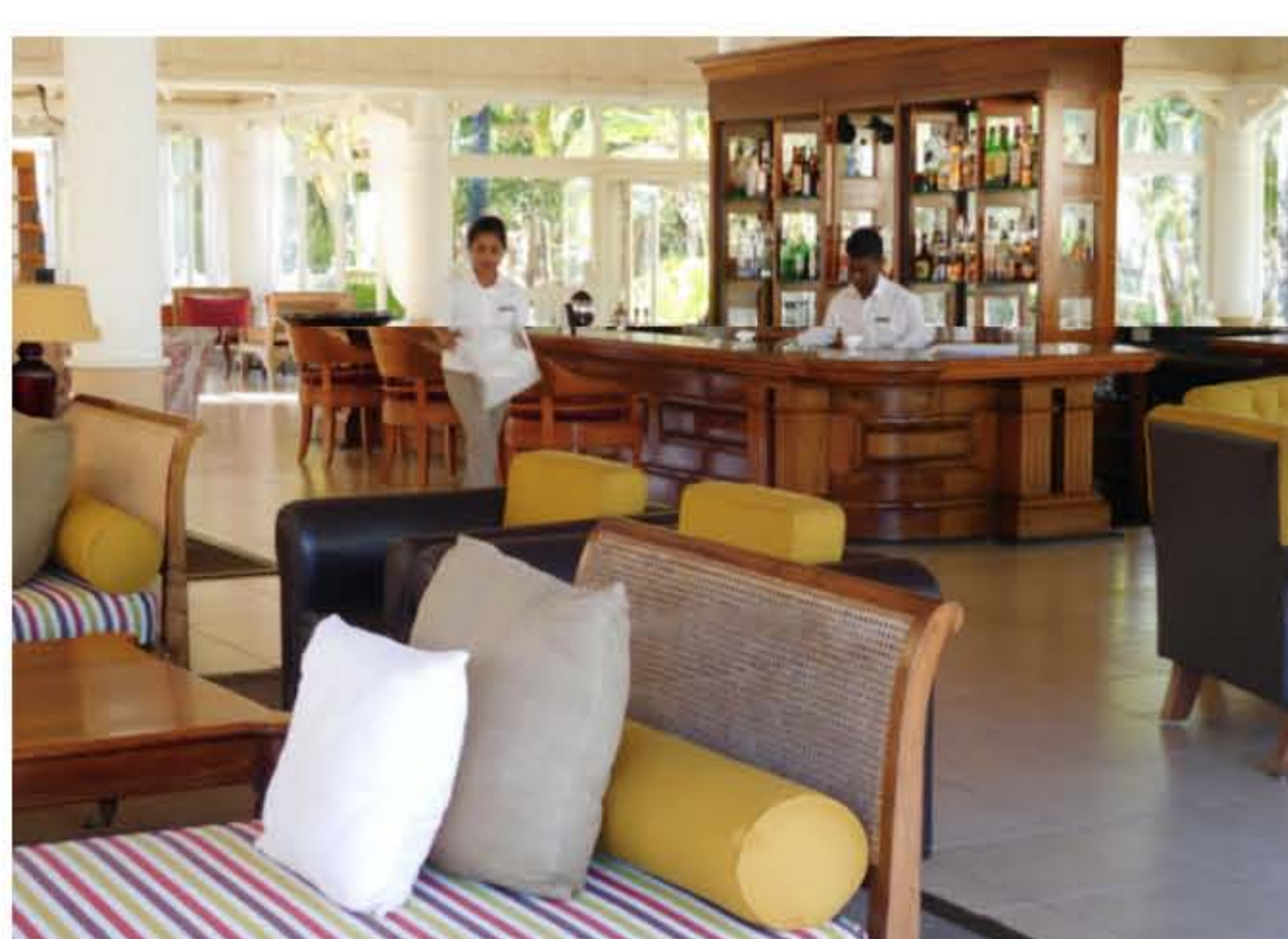
L'ambiance british du Cavendish Bar