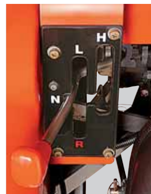
Leva del cambio di gamma