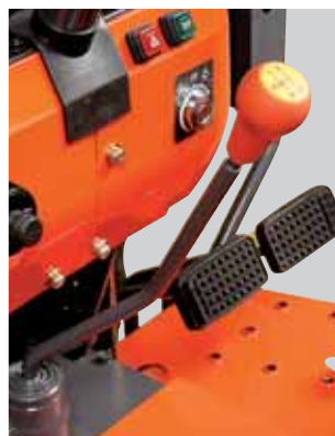
Leva del cambio principale (L3200)