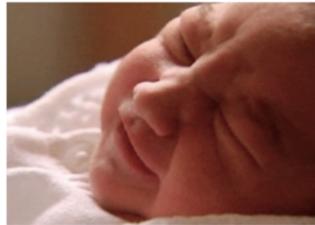
Impronta natal (consciente, personalidad)

sexto mes de embarazo (88° del movimiento solar antes del nacimiento)