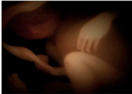
Impronta pre-natal (inconsciente)

sexto mes de embarazo (88° del movimiento solar antes del nacimiento)