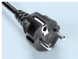
EURO plug 220-240 volt EURO prise 220-240 volts