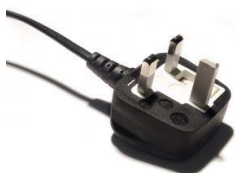
UK plug 220-240 volt Prise UK 220-240 volts

Avant utilisation, vérifier votre fiche pour s'assurer qu'il est la tension appropriée pour votre pays.