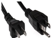
USA plug 110-120 can also be used in JAPAN USA bouchon 110-120 peut également être utilisé au Japon.