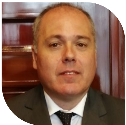
Director