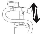
Figure 4 Inflate with AirBeam pump