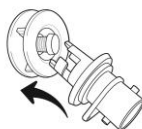
Figure 2 Insert locking pump connector