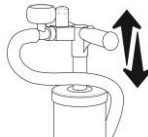
Figure 4 Inflate with AirBeam pump