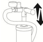
Figure 5 Inflate with AirBeam pump