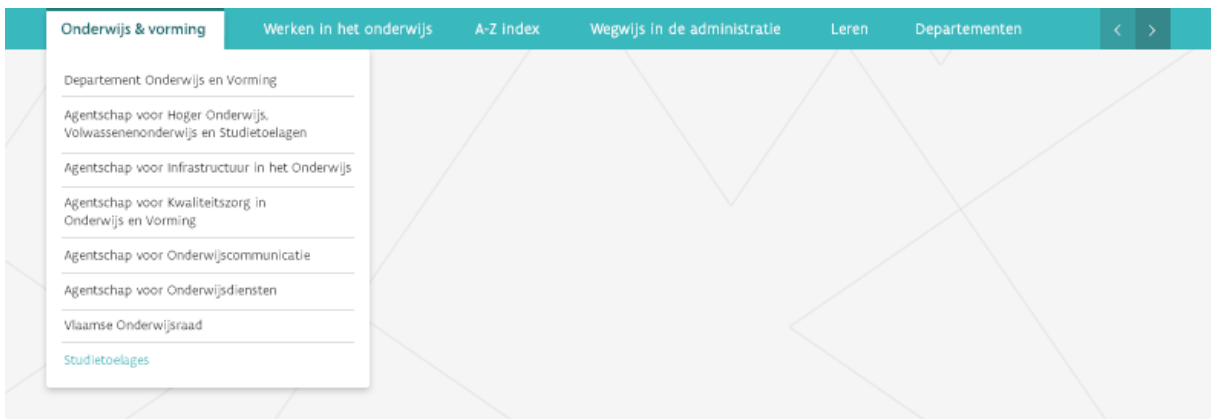
Figuur 3: De fly-out in actie