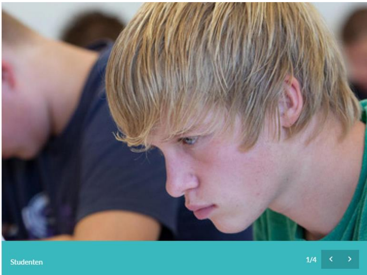
Figuur 1: Een carrousel.