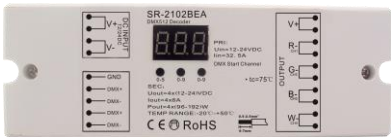
2102BEA: 4 x 8A konstant spenning