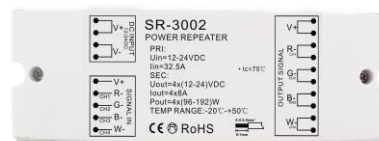
3002: 4 x 8A konstant spenning