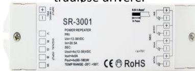
3001: 4 x 5A konstant spenning

Brukes om det er behov for å drive mange lamper/stor effekt fra samme PWR-utgang fra DALI, DMX, 0-10V eller trådløse drivere.