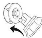
Figure 5 Insert locking cap