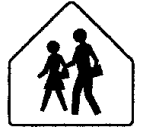
School Crossing Ahead

School Crossings and School Zones: School crossings and zones are usually posted along with the speed limit.