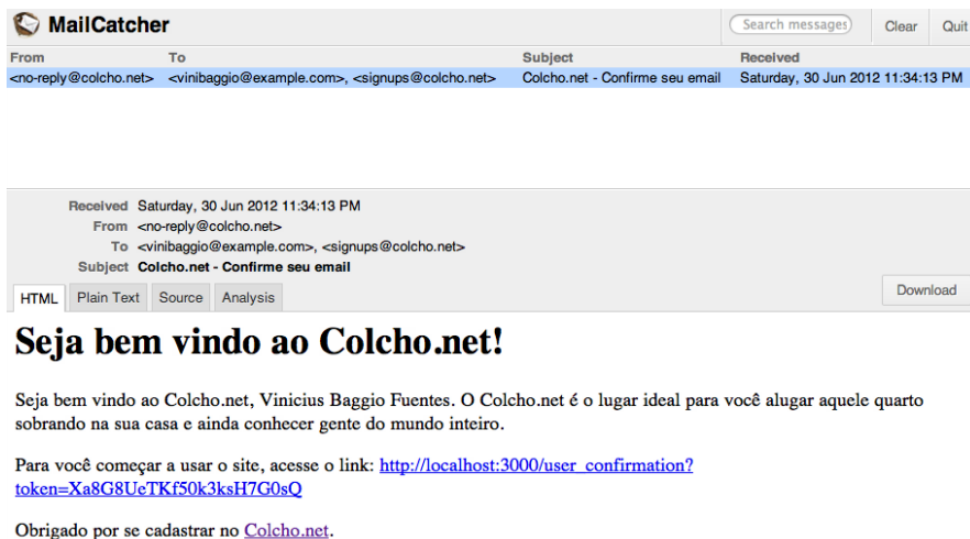
Figura 9.1: Email de confirmação no mailcatcher

Ao seguir o link no email, temos o seguinte resultado: