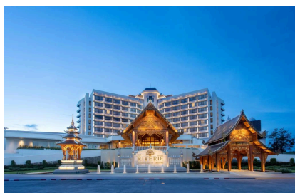
The Riverie by Katathani 5* Chiang Rai, Tailandia