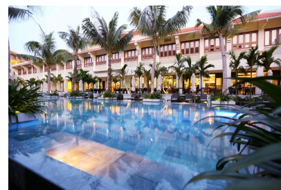
Almanity Hoi An 5* Hoi An, Vietnam