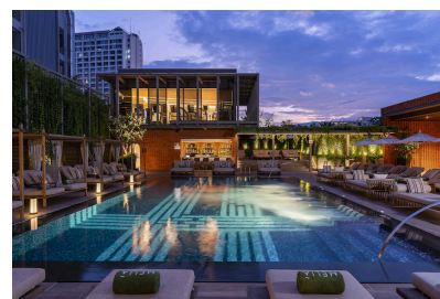
Melia Chiang Mai 5* Chiang Mai, Tailandia