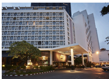
Hotel Montien Bangkok 5* Bangkok, Tailandia