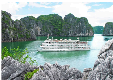
Au Co Cruise Crucero en Bahía de Halong