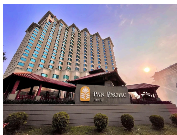
Pan Pacific Hanoi 5* Hanoi, Vietnam