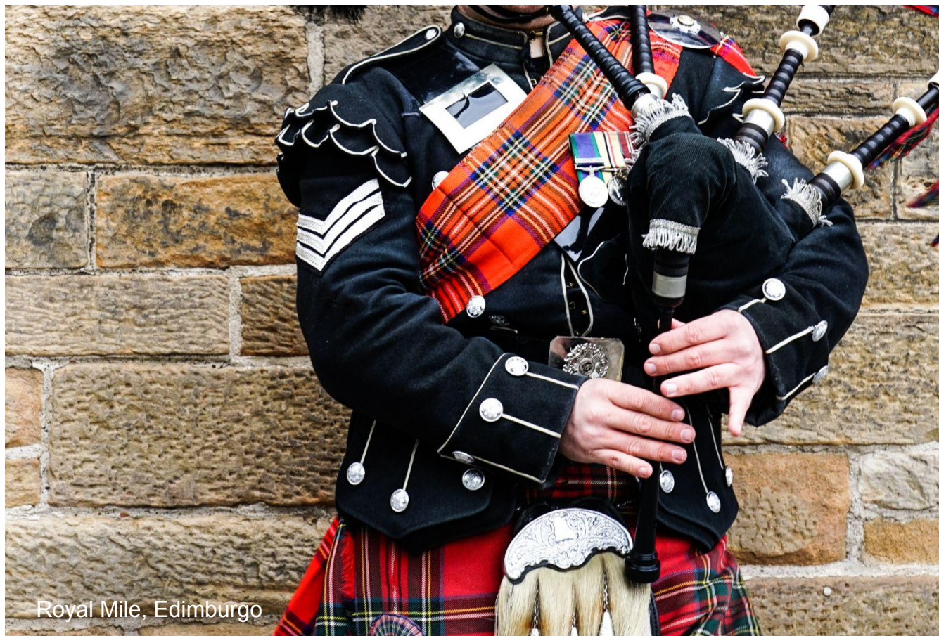
Royal Mile, Edimburgo