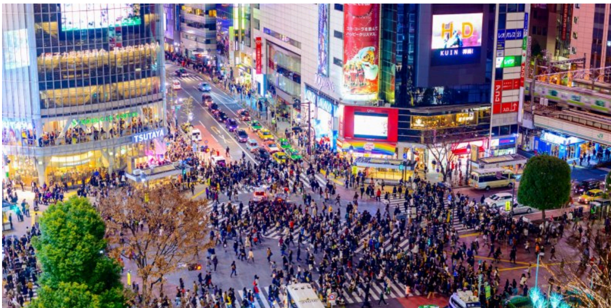
Barrio Shibuya y la luz verde en el cruce de 4 esquinas