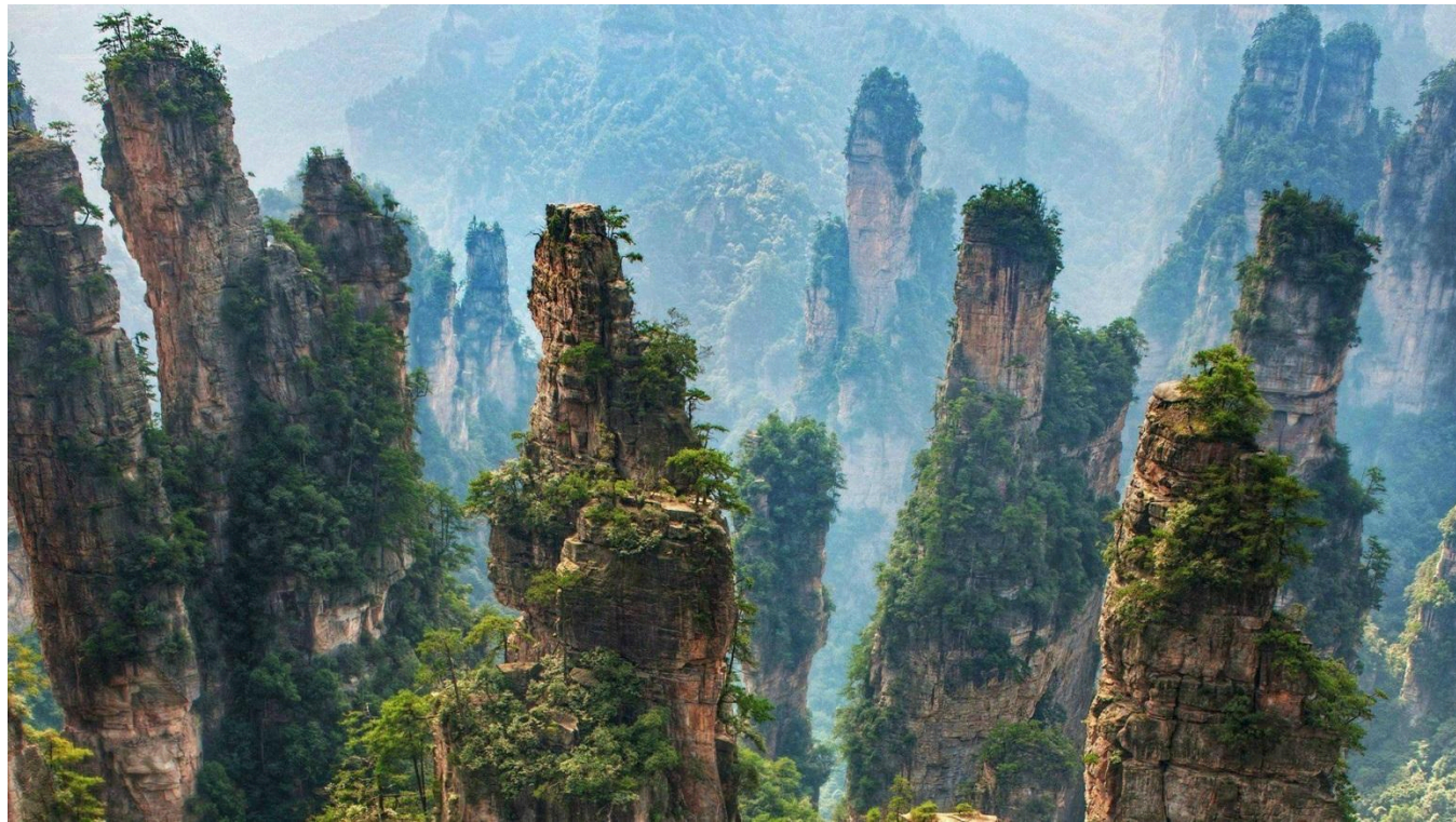
Paisaje que inspiró la película Avatar