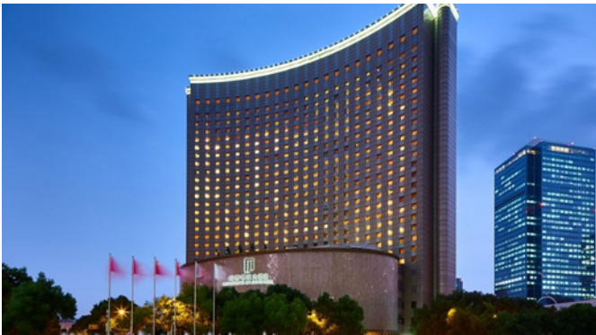
Grand Mercure Hongqiao