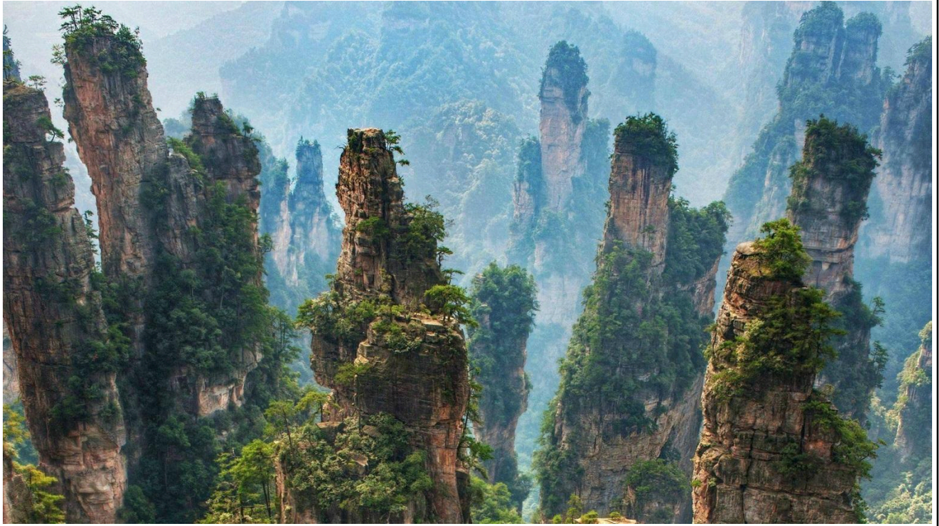
Paisaje que inspiró la película Avatar