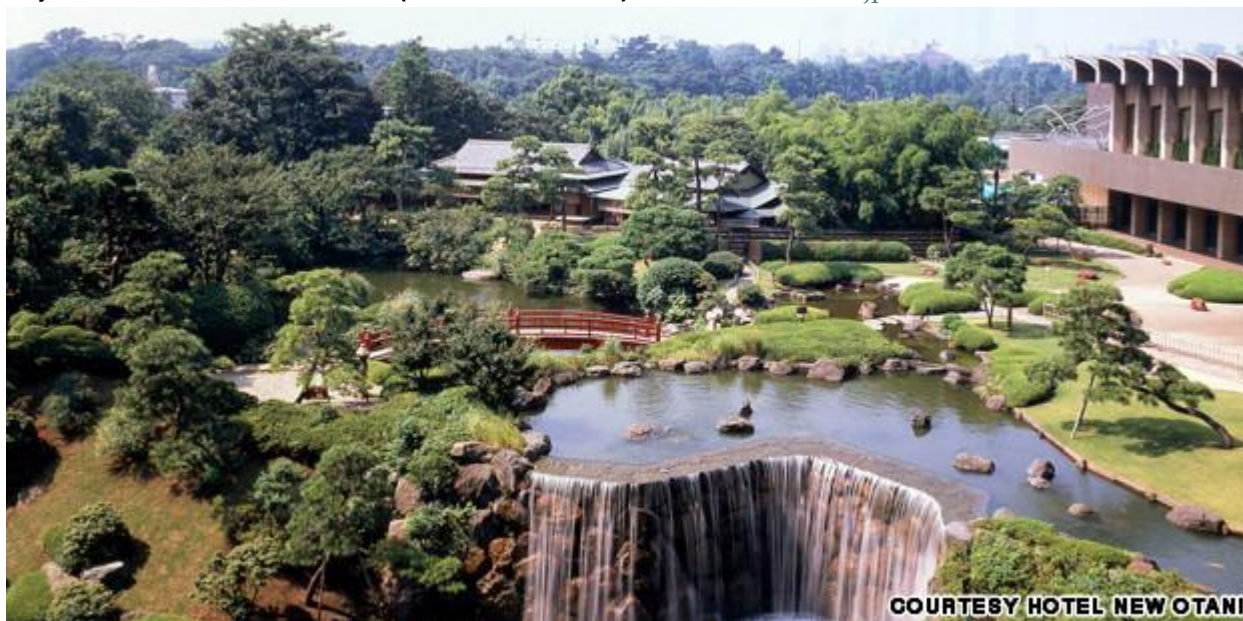
Jardines del Hotel.

Alojamiento en New Otani Tower (5* / Garden Tower) www.newotani.co.jp