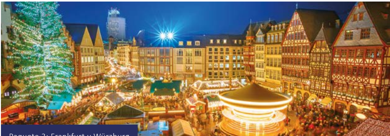
Paquete 3: Frankfurt y Würzburg

Traslado privado opcional al aeropuerto.