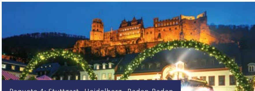
Paquete 4: Stuttgart- Heidelberg- Baden-Baden