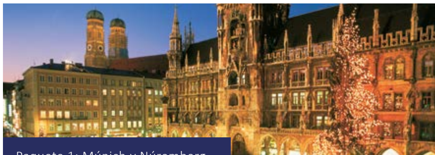
Paquete 1: Múnich y Núremberg

Al llegar a Múnich traslado privado opcional a su hotel.