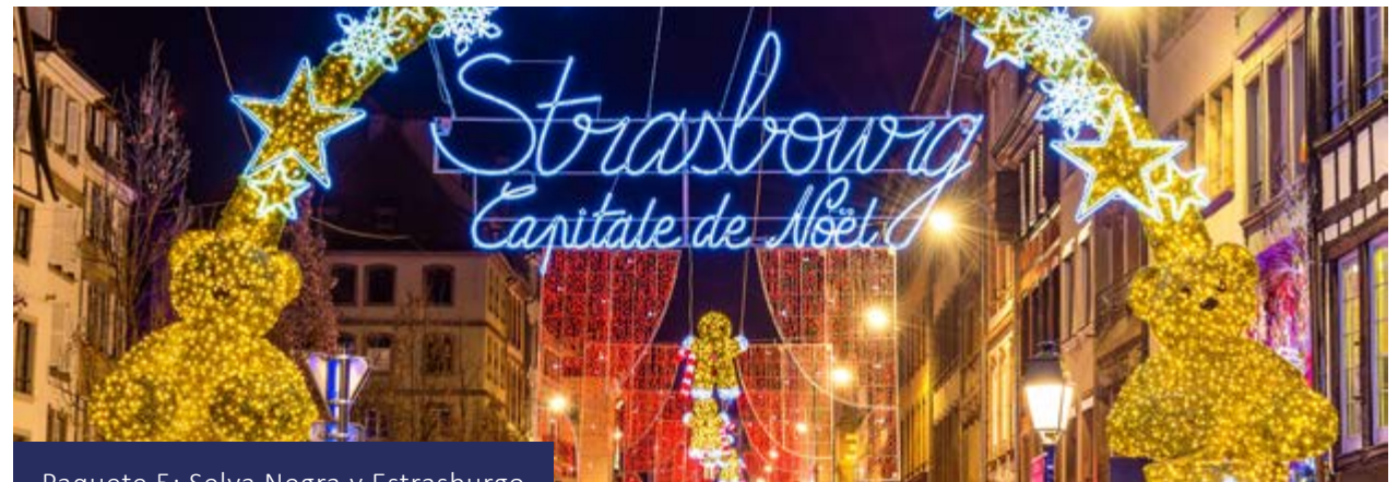
Paquete 5: Selva Negra y Estrasburgo

Si hay suficiente tiempo, puede visitar opcionalmente el mercado de Navidad en Esslingen, famoso por ofrecer un ambiente medieval muy especial. Traslado privado opcional al aeropuerto.