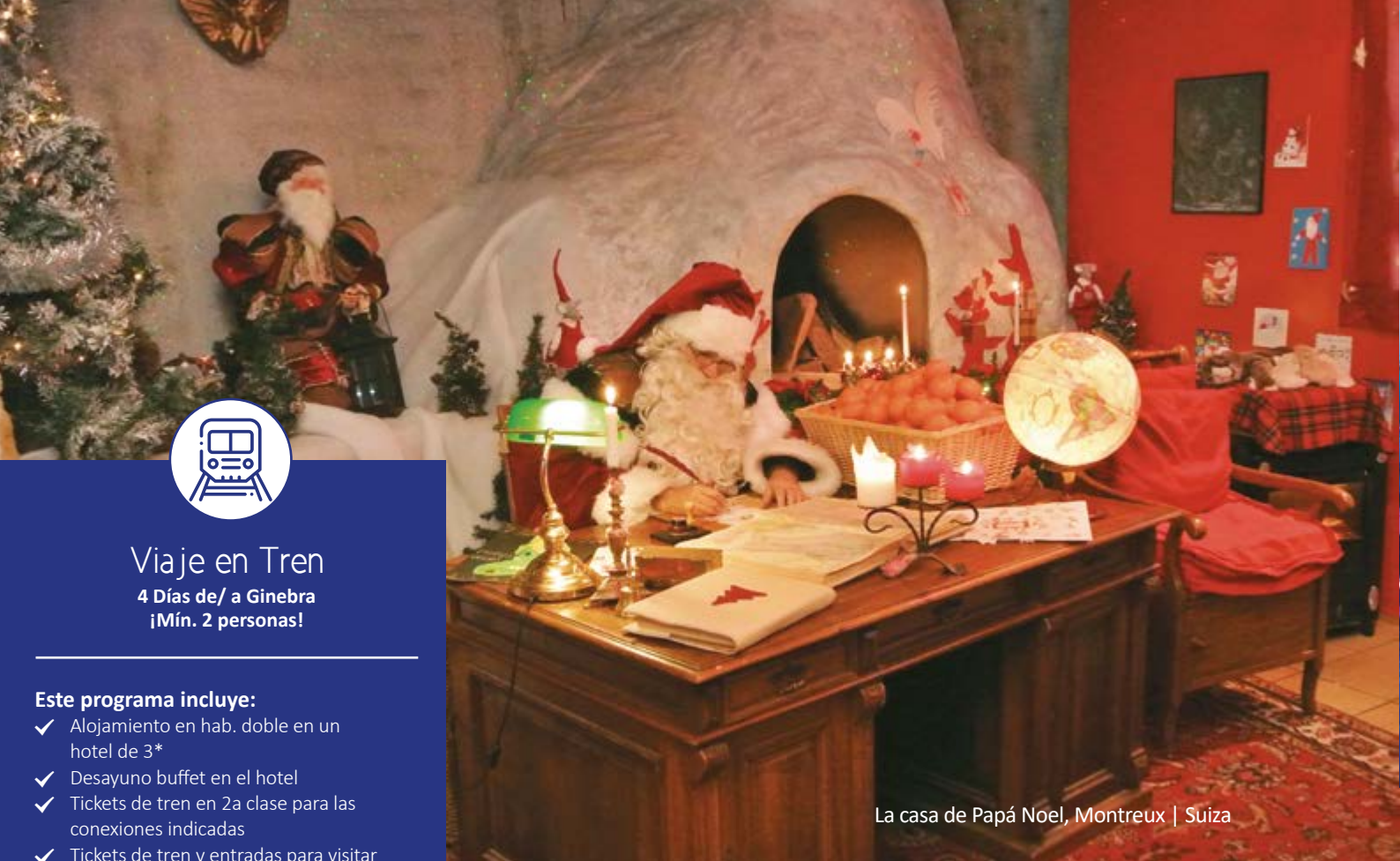
La casa de Papá Noel, Montreux | Suiza