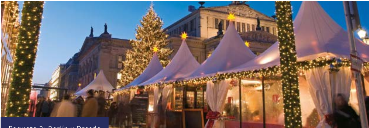
Paquete 2: Berlín y Dresde

Traslado privado opcional al aeropuerto.