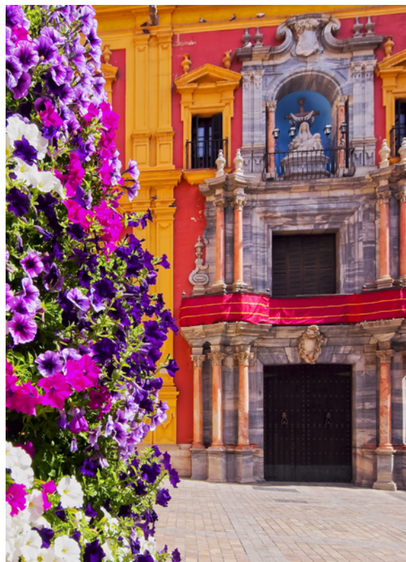
▲ PALACIO EPISCOPAL

Si te gustan las compras, en la calle del Marqués de Larios tienes las principales marcas de moda.