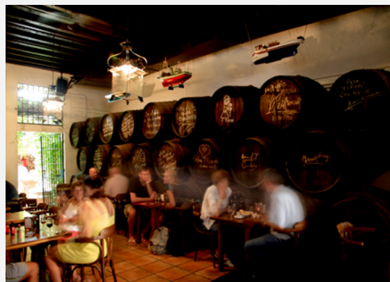
▲ BODEGA EL PIMPI

Recorre las calles desde la plaza de la Merced hasta la plaza de la Constitución , una de las principales zonas de marcha. Si prefieres espacios más relajados, visita La Malagueta , Muelle Uno o el paseo marítimo de Pedregalejo .