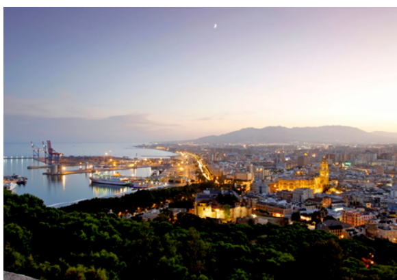
▲ VISTA AÉREA DE MÁLAGA

MUSEO PICASSO DE MÁLAGA