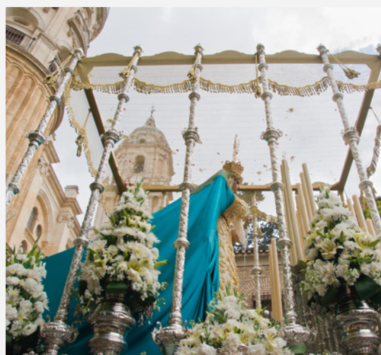
▲ SEMANA SANTA

Gracias a su clima suave podrás practicar actividades al aire libre como el golf, el senderismo o pasear a caballo por los pueblos de la sierra. El colorido del invierno malagueño gira en torno a la floración del almendro. Localidades como Casabermeja, Arenas, Ardales, Carratraca, Almogía, Periana o Guaro se llenan de tonalidades blancas y rosáceas.