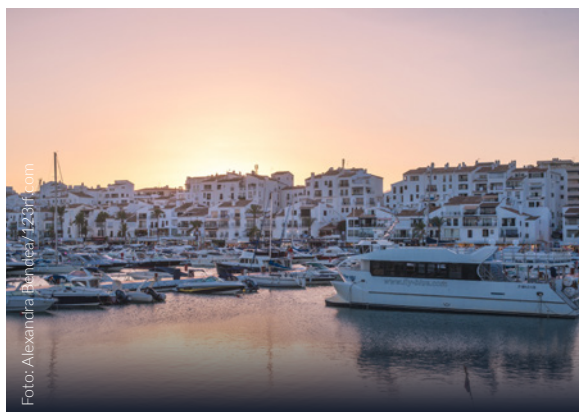
▲ PUERTO BANÚS MARBELLA

Te impactará el desfiladero de más de 150 metros de profundidad que parte la ciudad en dos. Verás los tres puentes que lo atraviesan: el más famoso es el Puente Nuevo , del siglo XVIII. Recorre su casco antiguo, de trazado medieval y con influencia árabe.