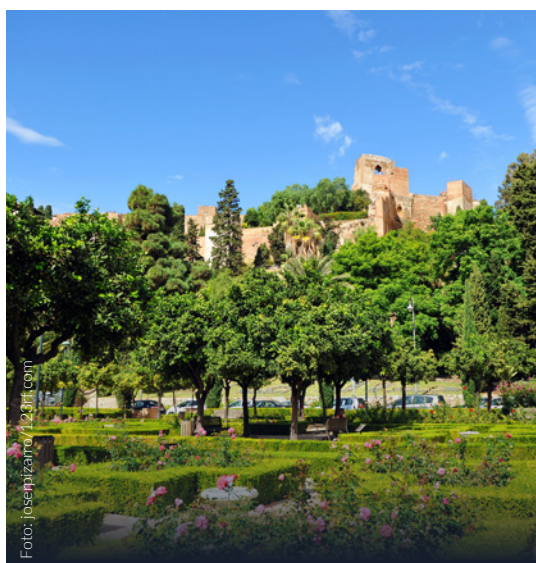
▲ JARDINES DE PEDRO LUIS ALONSO

Los jardines de Pedro Luis Alonso , de diseño latino, con influencia hispanoárabe y francesa, te esperan con sus naranjos, sus estanques y una bella rosaleda. Cerca, en la ladera sur del monte Gibralfaro, encontrarás los jardines de Puerta Oscura , que mezcla vegetación con fuentes, paseos, glorietas y terrazas.