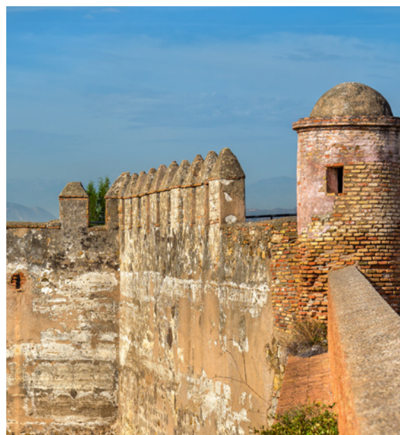
▲ EL CASTILLO DE GIBRALFARO

Para sumergirte en la historia de la ciudad desde la época romana hasta la actualidad, sigue la ruta de la Málaga monumental . Completa el itinerario con una visita al castillo de Gibralfaro .