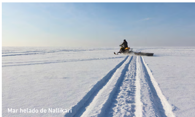
Mar helado de Nallikari

Encuentro con el guía y salida para una aventura en el mar helado de Nallikari, donde se realizará una caminata por el mar Báltico congelado, con una actividad de pesca en hielo utilizando equipo tradicional. Al finalizar, continuación hacia Rovaniemi – ¡La ciudad oficial de Papá Noel! Tu mágico viaje en el Círculo Polar Ártico, Laponia, Finlandia comienza aquí. La tarde es libre.