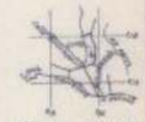
UBICACION DEL LOTE Lote 10 de la Zona 10 Escala: 1:50,000

NOTAS: 1. El presente plan es copia de uno de los planos que se expusieron en el proceso de inscripción registral de la finca. 2. El presente plan es copia de uno de los planos que se expusieron en el proceso de inscripción registral de la finca. 3. El presente plan es copia de uno de los planos que se expusieron en el proceso de inscripción registral de la finca.