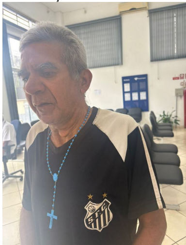
Atualização na receita federal e no Poupatempo 19/11/2025

Valorização do usuário em pequenas conquistas no processo de autonomia em construção de um novo projeto de vida.