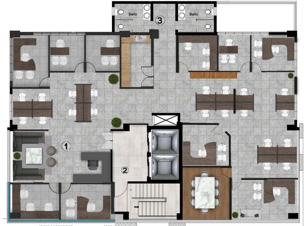
Planta Amueblada Nivel 6