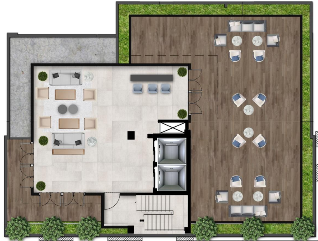
Planta Amueblada RoofTop Nivel 7