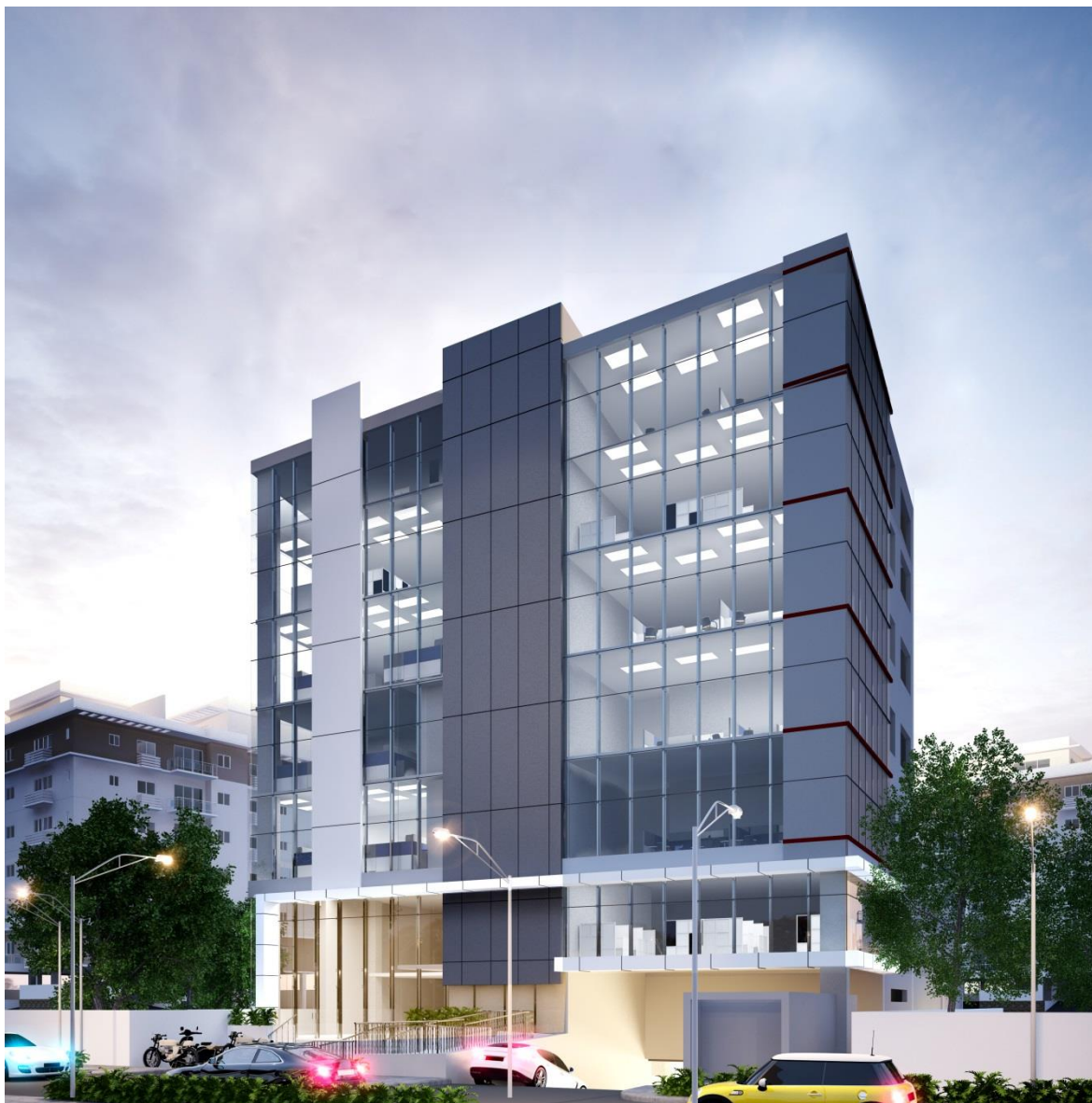
TORRE NOVOLED Los Prados, Santo Domingo, R.D.