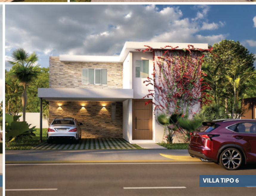
VILLA TIPO 6