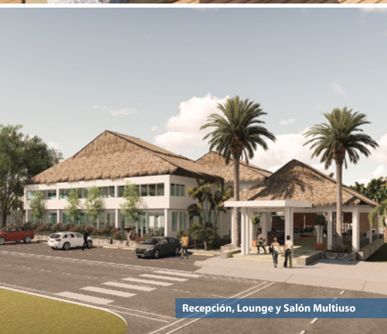
Recepción, Lounge y Salón Multiuso