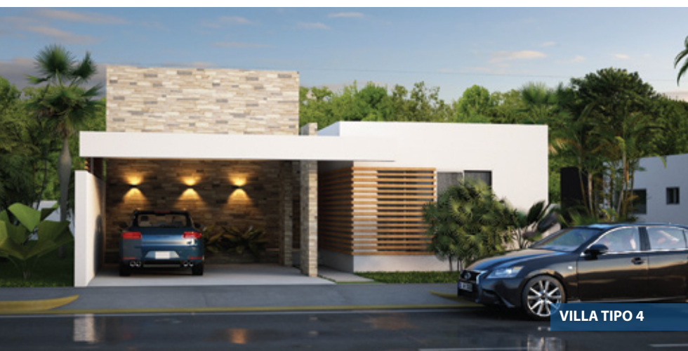
VILLA TIPO 4