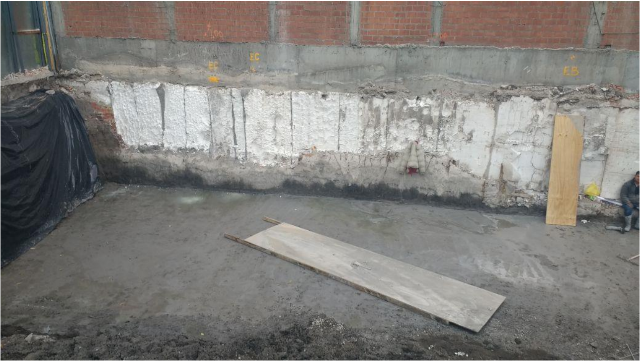
5) Colado de plantilla de concreto en el fondo de la cimentación para habilitar acero