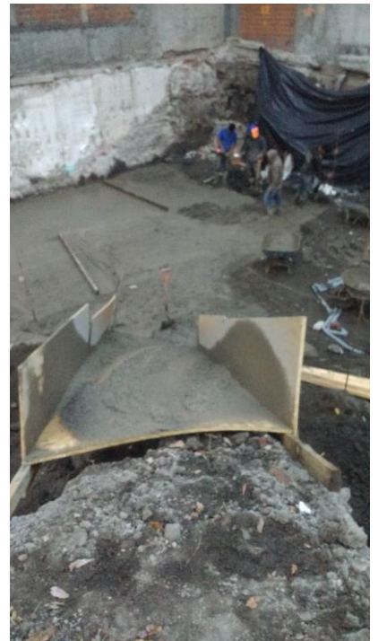
4) Se habilito área de desplante de losa fondo con el colado de plantilla de cemento y arena.