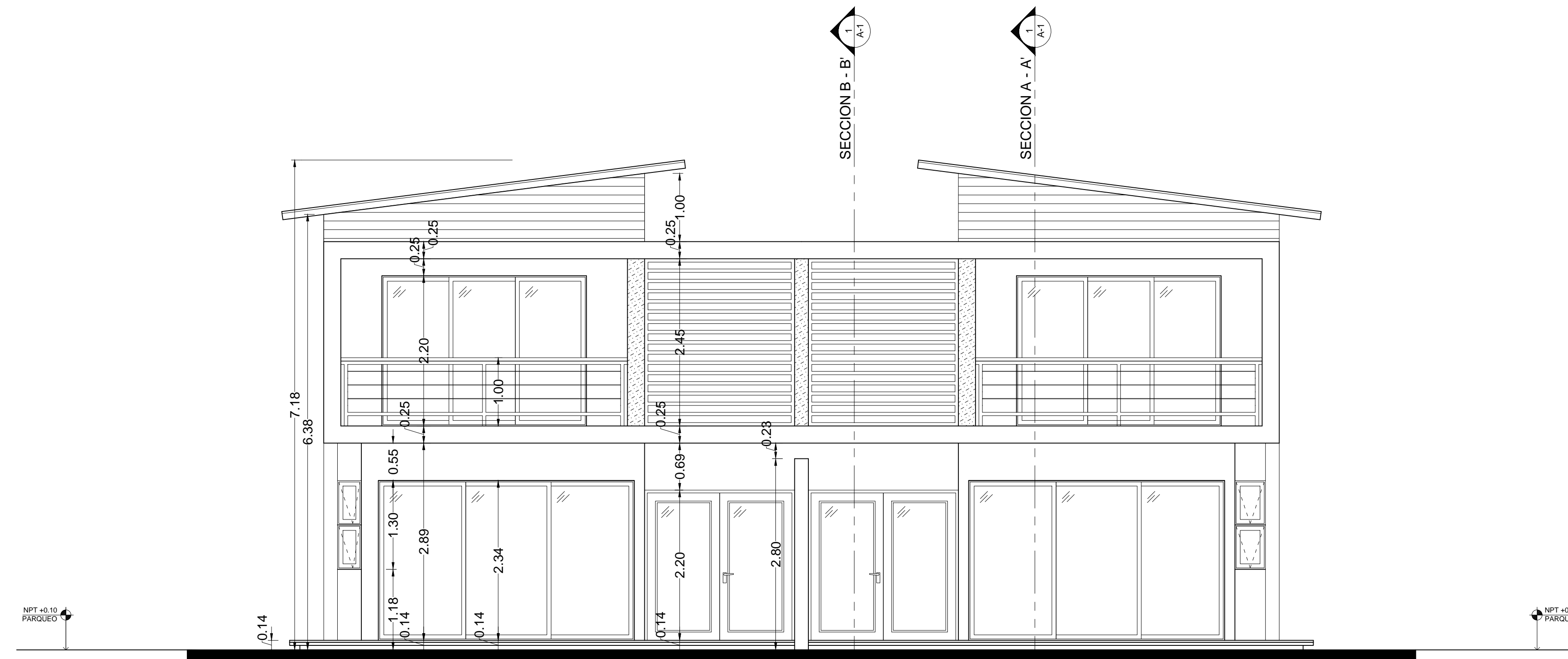
1 A-2 ELEVACION POSTERIOR ESCALA 1:50