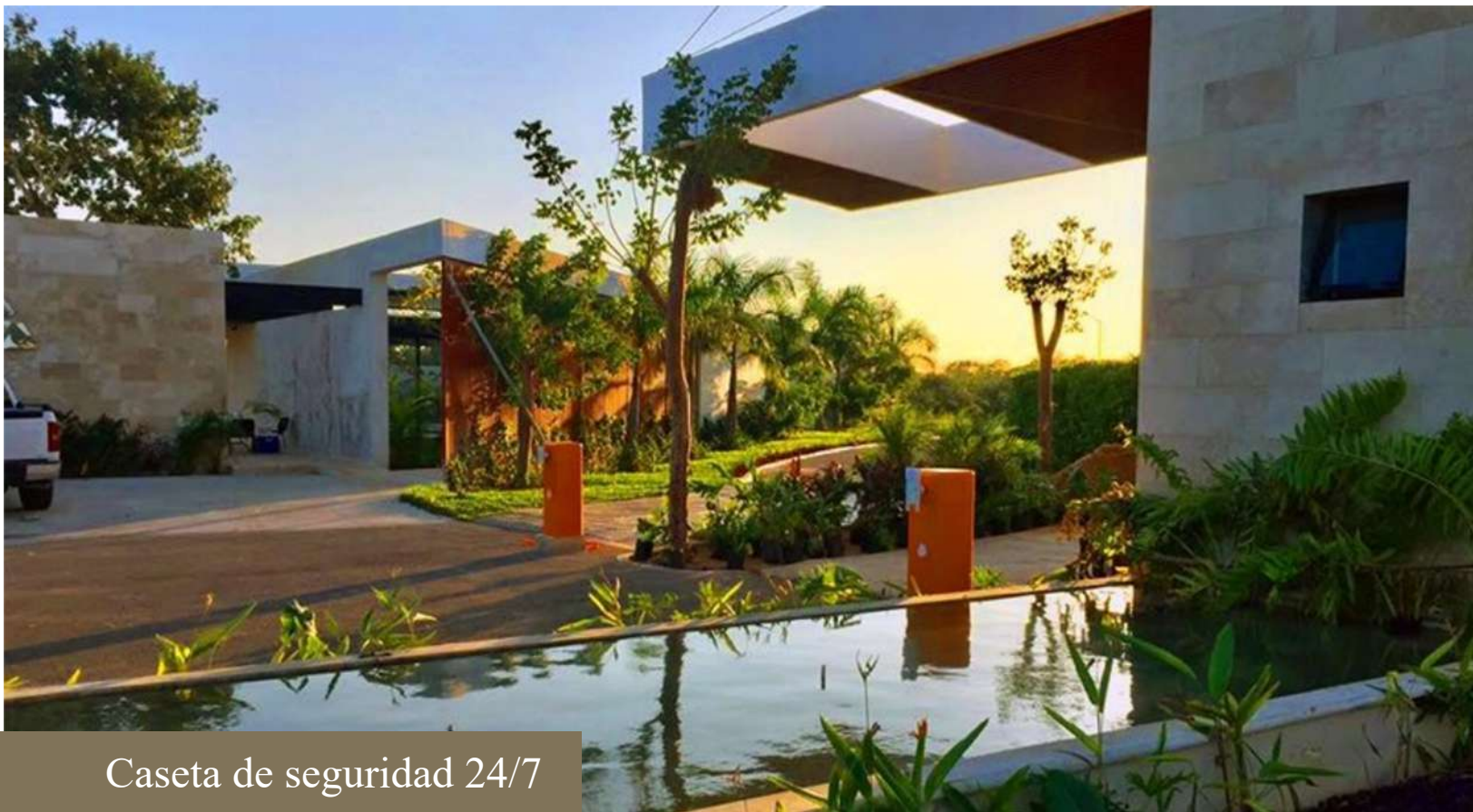
Caseta de seguridad 24/7