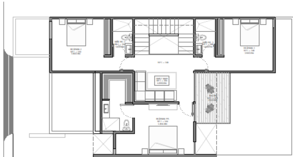
PLANTA ALTA 117.20 m 2