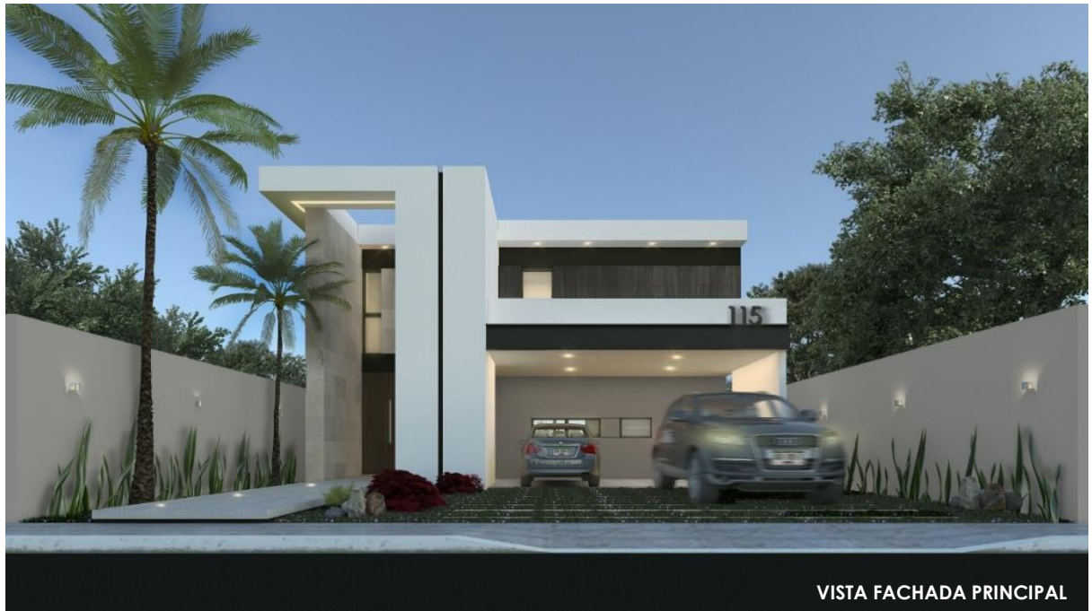
VISTA FACHADA PRINCIPAL

Terreno: 12.00 x 27.85m// Construcción: 260.00m 2