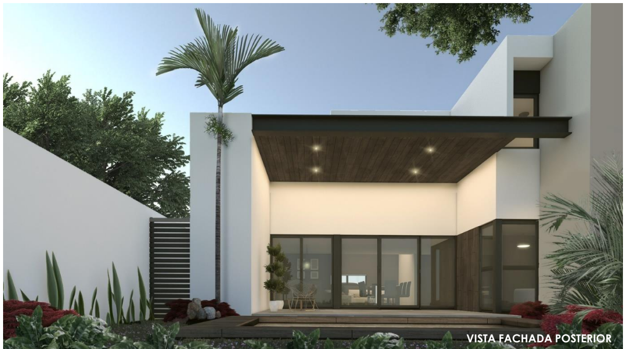
VISTA FACHADA POSTERIOR