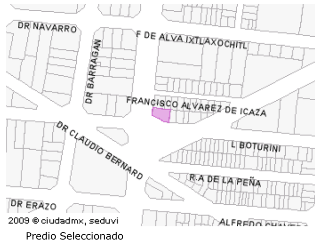
2009 © ciudadmx, seduvi Predio Seleccionado

Este croquis puede no contener las ultimas modificaciones al predio, producto de fusiones y/o subdivisiones llevadas a cabo por el propietario.