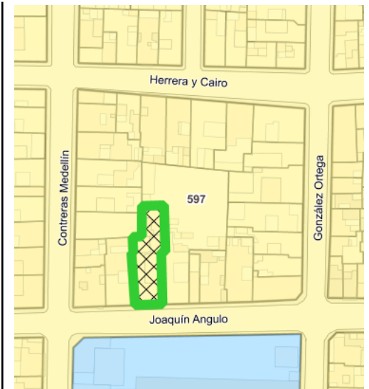
Croquis de Manzana