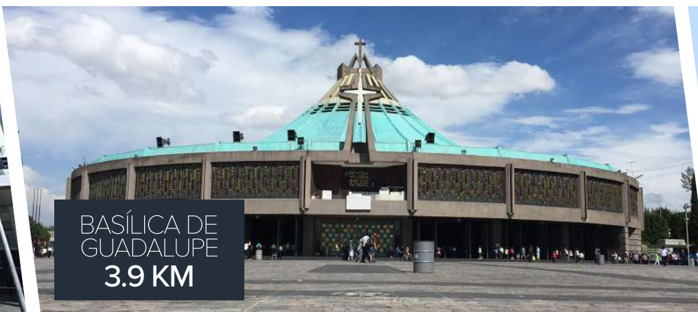
BASÍLICA DE GUADALUPE 3.9 KM