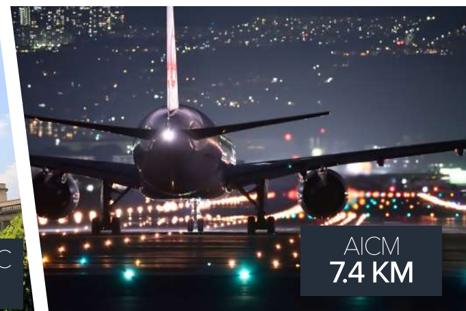
AICM 7.4 KM