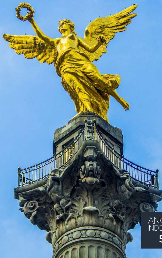
ANGEL DE LA INDEPENDENCIA 5.4 KM