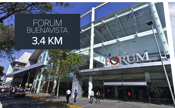
FORUM BUENAVISTA 3.4 KM