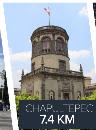
CHAPULTEPEC 7.4 KM