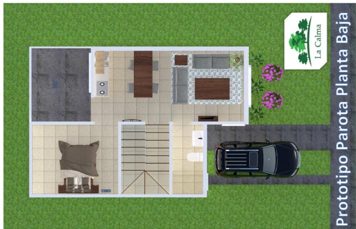
Prototipo Parota Planta Baja

Plaza Villas Vallarta Local H2B, Av. Francisco Medina Ascencio 1989 Zona Hotelera Norte C.P. 48333 Puerto Vallarta Jalisco. Tel. / Fax 011 52 (322) 224 8563 www.vluxuryrealestate.com