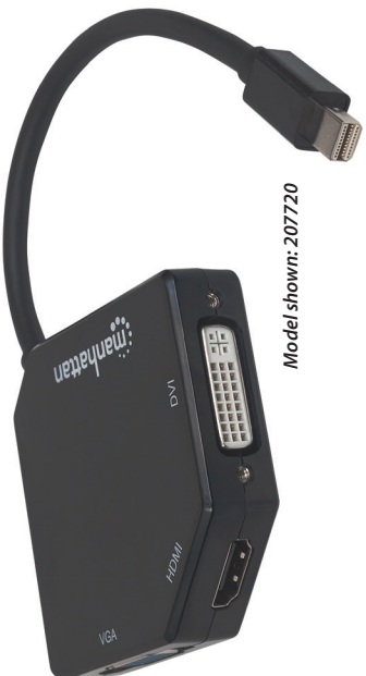
Model shown: 207720