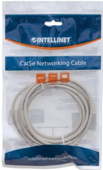
3 m (10 ft.) shown