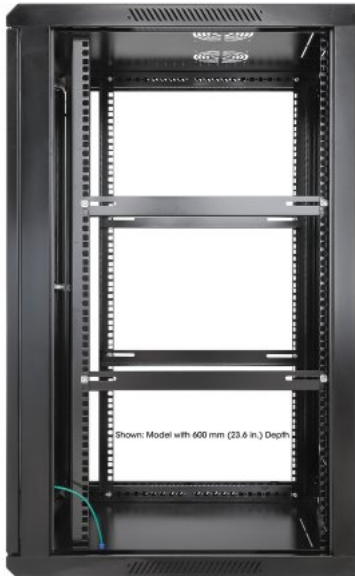
Shown: Model with 600 mm (23.6 in.) Depth