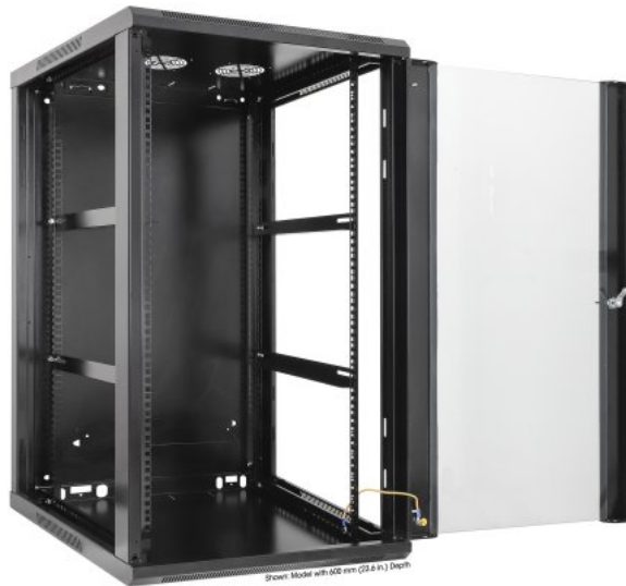
Shown: Model with 600 mm (23.6 in.) Depth