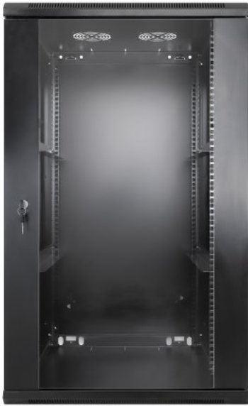
Shown: Model with 600 mm (23.6 in.) Depth