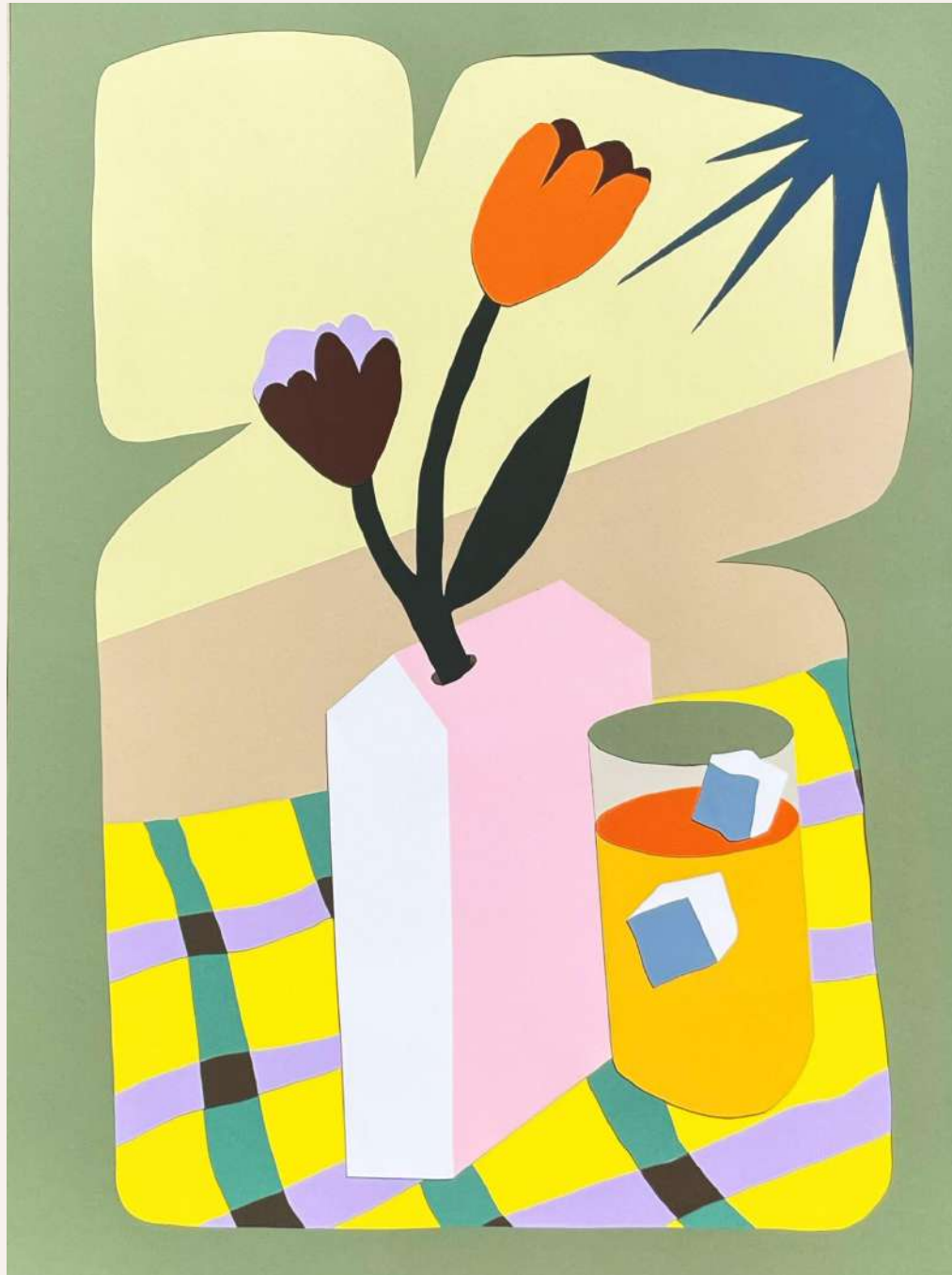
Alice Bottigliero, Orangeade