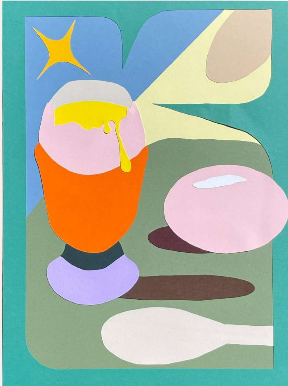
Alice Bottigliero, Mouillette en approche