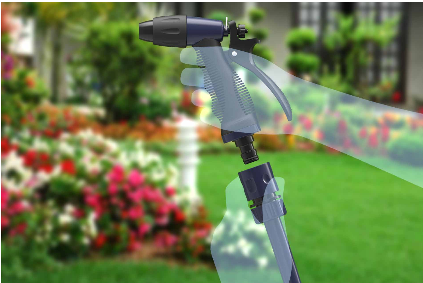
VISTA DO PRODUTO APLICADO.