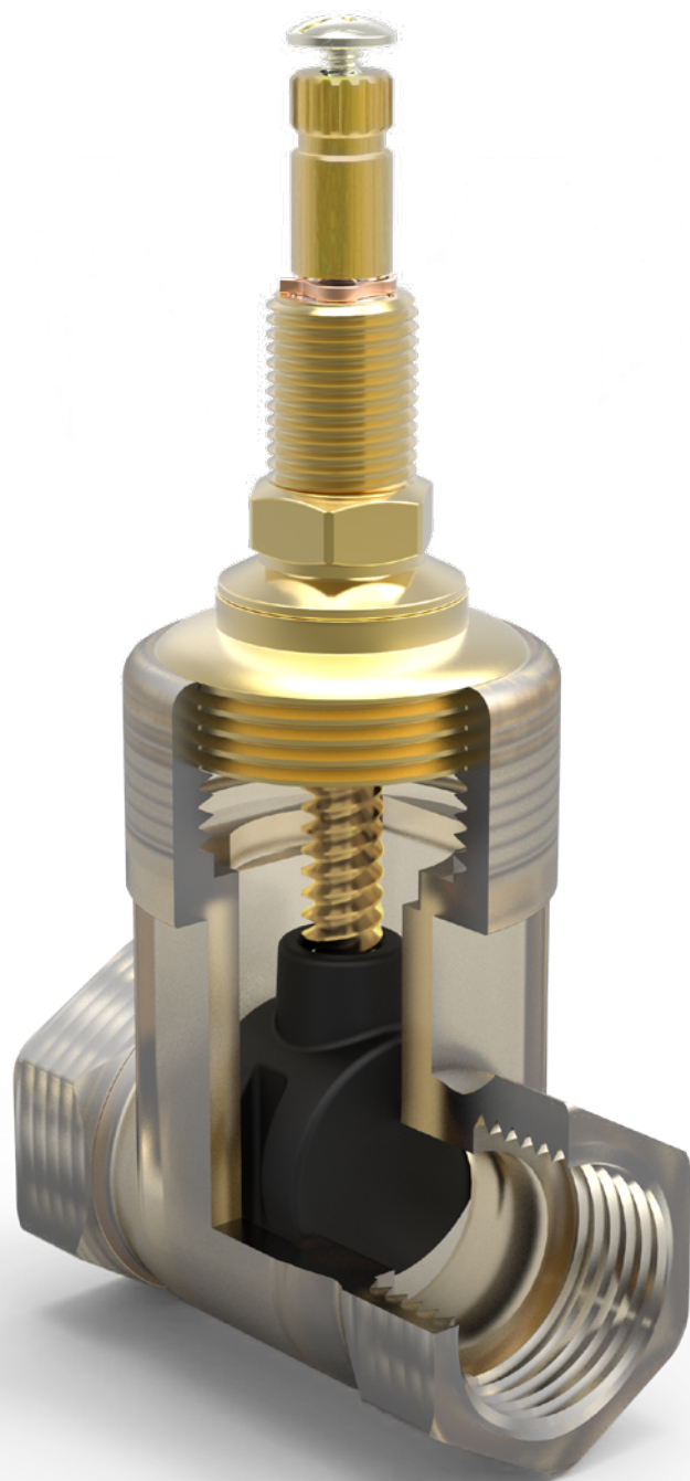
VISTA DE APLICAÇÃO.