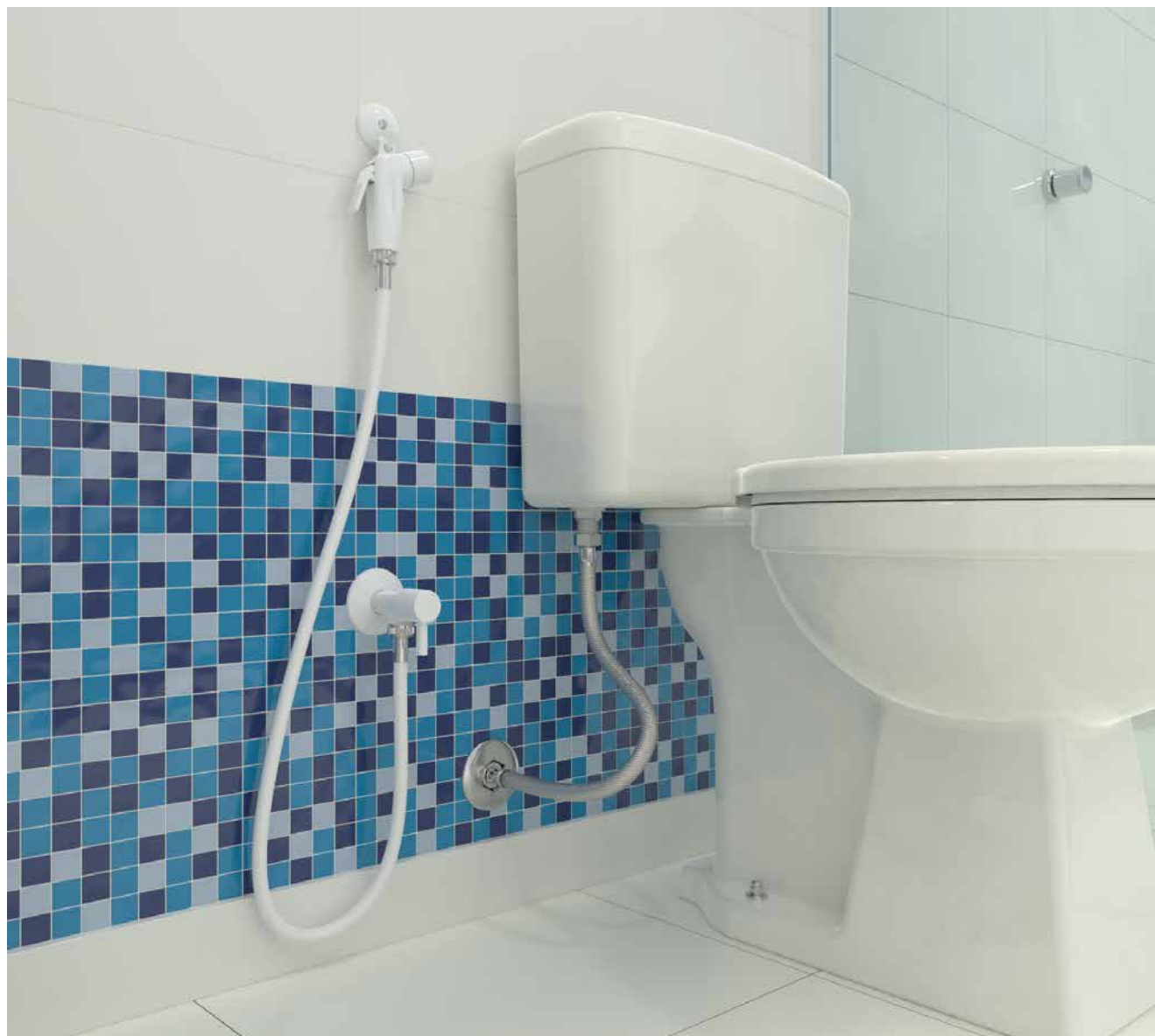
VISTA DE APLICAÇÃO.