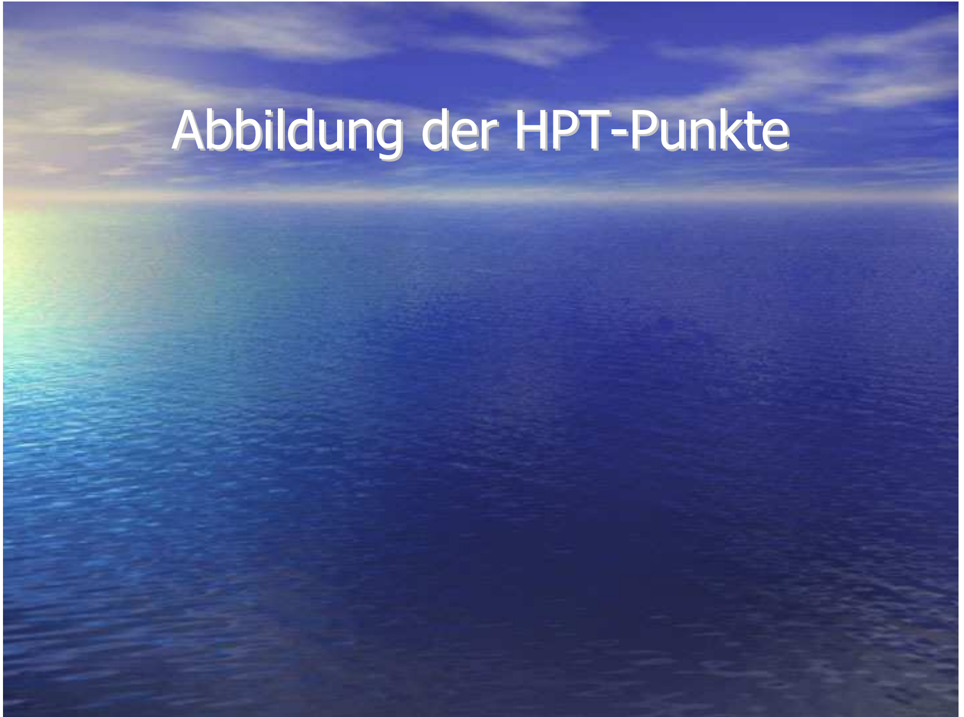
Abbildung der HPT-Punkte