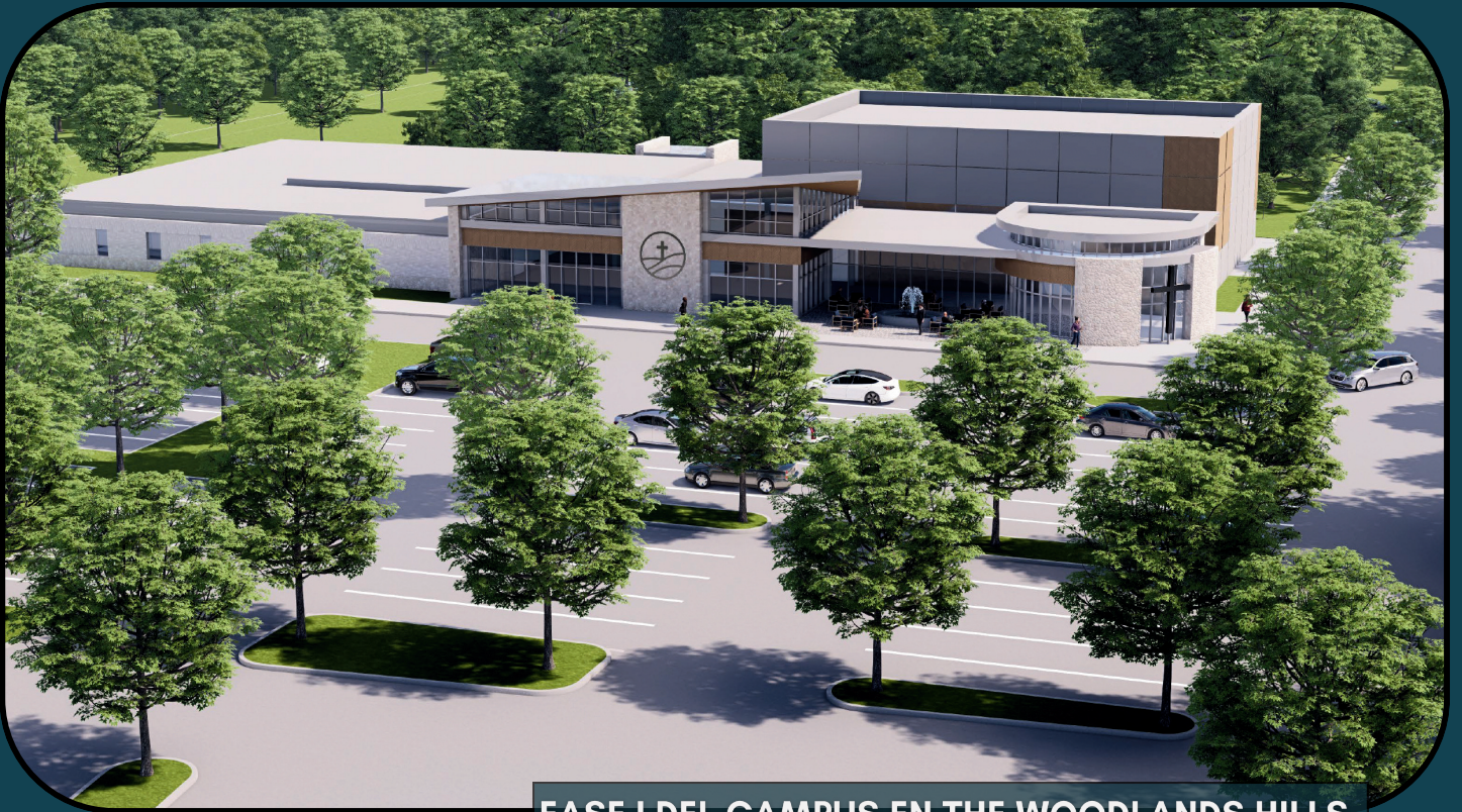
FASE I DEL CAMPUS EN THE WOODLANDS HILLS