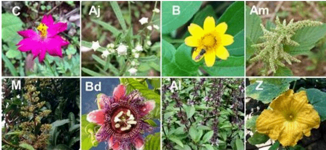
Figura 1. Especies de plantas involucradas en la red de polinizadores en el agroecosistema de Los Andes, Valle del Cauca, Colombia. De izquierda a derecha los nombres comunes y taxonómicos de las especies de planta, C: Correo ( Cosmos caudatus ); Aj: Ajenjo macho ( Artemisia vulgaris ); B: Botoncillo ( Acmella mutisii ); Am: Amaranto ( Amaranthus spinosus ); M: Mango ( Mangifera indica ); Bd: Badea ( Passiflora quadrangularis ); Al: Albahaca ( Ocimum basilicum ); Z: Zapallo ( Cucurbita maxima ).

se colectaron flores de otros individuos fuera de la parcela de observación, a las cuales se les midió el largo y ancho de la corola con un pie de rey. Se tomaron flores de tres individuos por especie de planta (tres flores por especie) y se obtuvo un promedio de cada rasgo por especie. Se contó el número de unidades florales de cada especie de planta antes de cada jornada de muestreo, para obtener un promedio de la abundancia floral disponible. La abundancia fue estimada como el número máximo de flores disponibles por especie de planta.