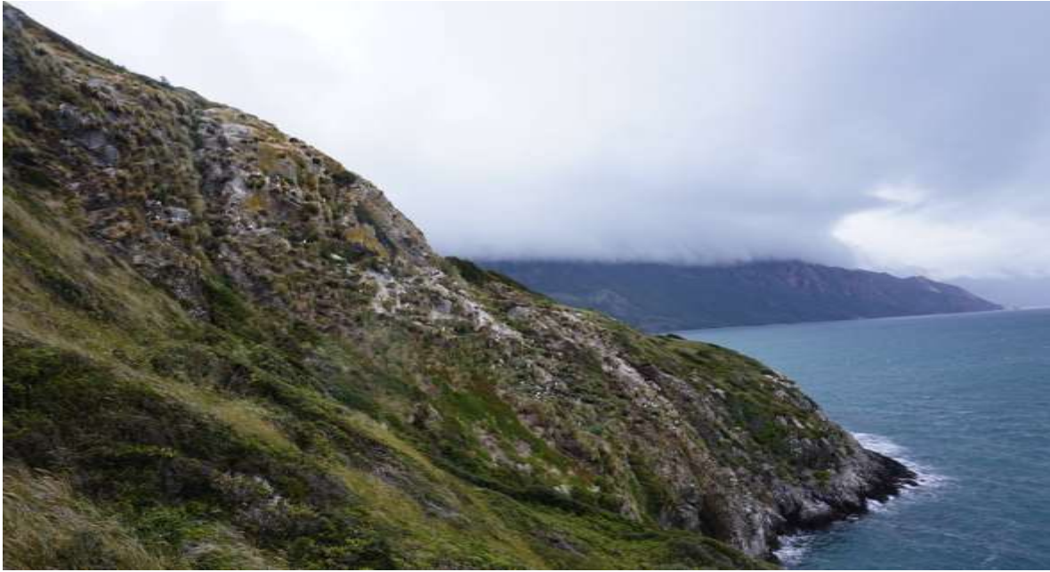
Figura 4. Vista de la parte principal de la colonia tomada en febrero del 2016, cuando todos los nidos se encontraron inactivos.