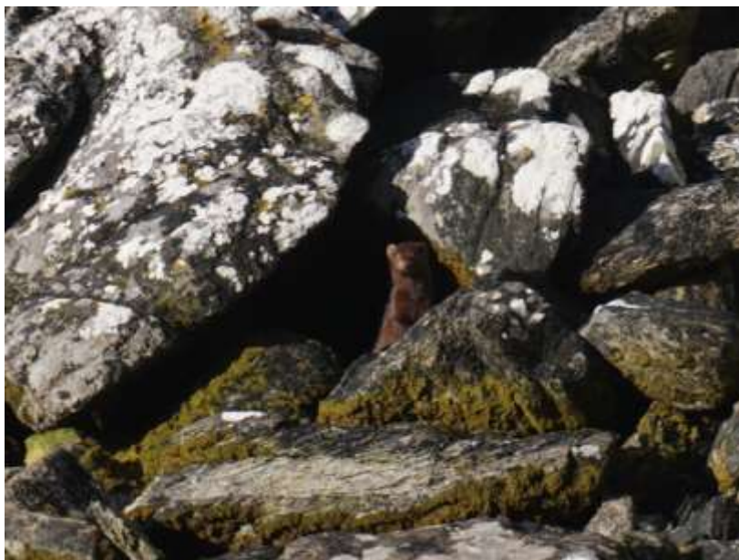
Figura 6. En la fotografía superior se muestra un ejemplar adulto, captado el 13 de febrero del 2016, y en la fotografía inferior, un ejemplar juvenil, captado el 12 de febrero.