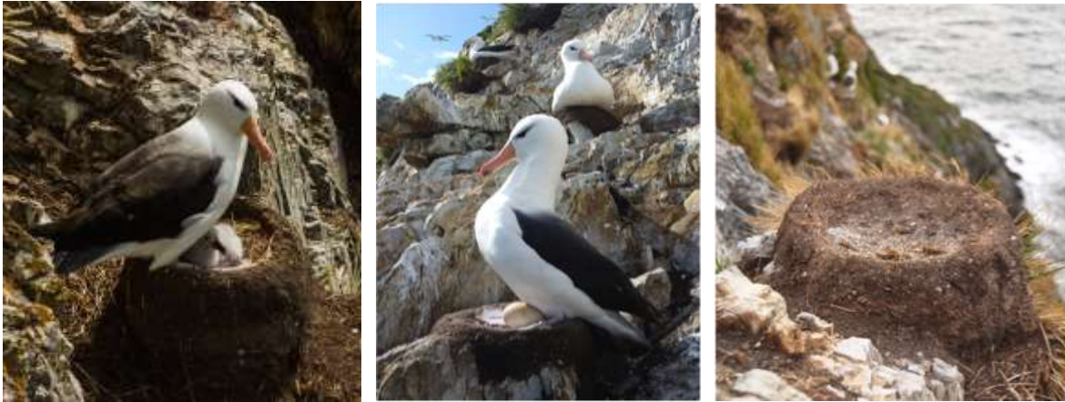
Figuras 5. Registros de nidos activos con adulto y un polluelo (izquierda), nido activo con un adulto y un huevo (centro), y nido inactivo (izquierda), fotos tomadas en noviembre del 2015.