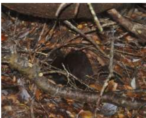
Figura 3. Fotografía obtenida de un ejemplar de visón Neovison vison en el bosque costero del islote Albatros.