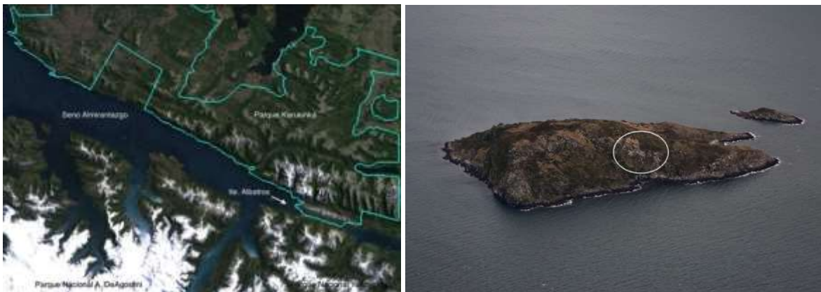
Figura 1. Localización del islote Albatros en el Seno Almirantazgo (izquierda), y vista aérea del mismo indicando la ubicación de la colonia de albatros de ceja negra (derecha).