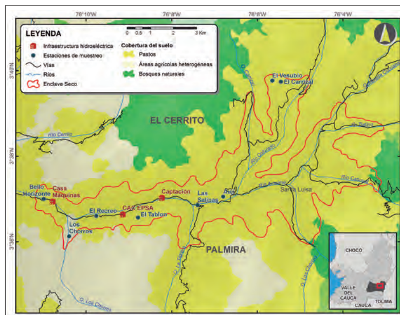
Figura 1. Mapa del enclave seco del río Amaime, indicando las estaciones de muestreo e infraestructura del Proyecto Hidroeléctrico Amaime de EPSA.

Para lograr el objetivo del proyecto se realizó un inventario de aves, mamíferos, anfibios, reptiles y plantas. Para el registro y toma de datos de las aves se usaron redes de niebla y transectos, para mamíferos