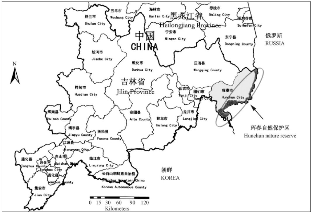
图 1 吉林珲春国家级自然保护区位置示意图

有马鹿、豹、野猪、梅花鹿、狗獾 ( Meles meles )、貉 ( Nyctereutes procyonoides )、赤狐 ( Vulpes vulpes )、东北兔 ( Lepus mandshuricus ) 等 [15] 。