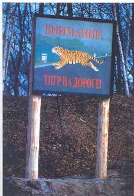
Этот знак был установлен после того, как тигренок Кати был сбит грузовиком на перевале Хунтами в Сихотлинском заповеднике.