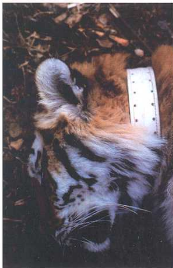
Эмма находится под анестезией во время отлова и радиомечения в ноябре 1997 г.

Возможно самую тревожную картину мы обнаружили на территории, где дорога Терней-Пластун пересекает заповедник. Эта дорога используется интенсивнее всех остальных дорог, расположенных на территории наших исследований, хотя на ней гораздо меньше движения, чем на многих дорогах, расположенных в местах обитания тигра. Здесь расположены лучшие местообитания тигра в Сихотэ-Алинском заповеднике, где плотность копытных очень высока, следовательно, эта территория могла бы быть источником для тигров,