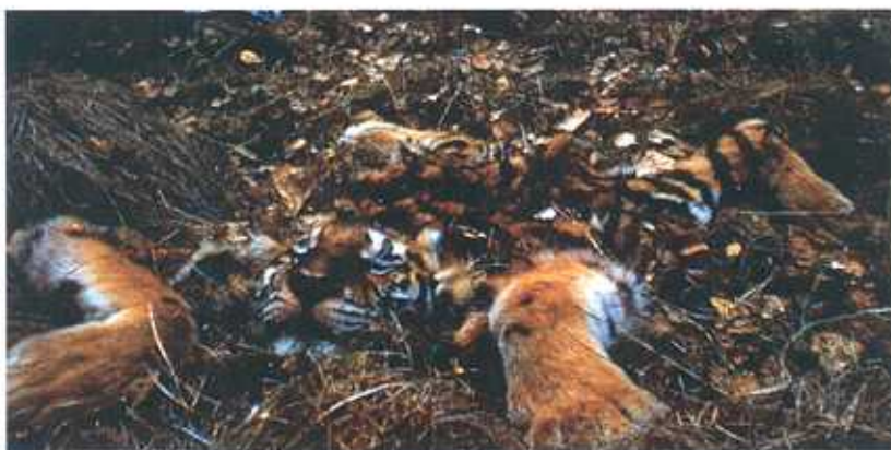
Тигренок Кати, после того как его сбил грузовик на перевале Хунтами в Сихотэ-Алинском заповеднике.

Незаконный отстрел копытных также происходит гораздо чаще на территориях, куда можно добраться по дороге. Если мы хотим сократить уровень браконьерства для