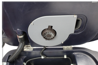
VACÍO DE ALTA POTENCIA