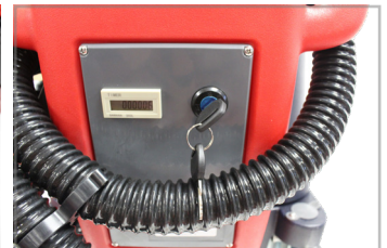
LLAVE DE ARRANQUE