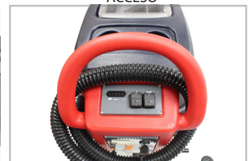
CONTROLES FÁCILES DE USAR