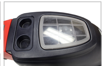
TANQUE DE RECUPERACIÓN DE FÁCIL ACCESO