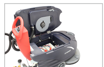
COMPACTO CON FÁCIL USO