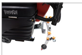
ESCOBILLA CURVADA PARA UNA MEJOR COLECCIÓN